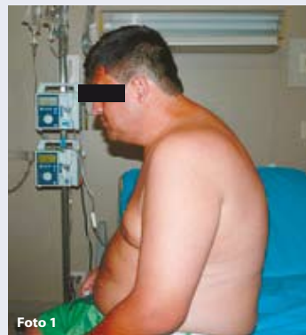
Paciente con EA con cifosis, pérdida de la extensión de la columna cervical y mirada horizontal

La limitación de la movilidad de la columna suele producir en los pacientes una inclinación hacia delante (Cifosis, Foto 1) con una marcha tipo robótica ya que tiene limitación para los movimientos de rotación de la columna. La cifosis progresiva hace que los paciente pierdan la mirada horizontal, lo cual produce que los pacientes tengan que flexionar las rodillas para tratar de compensar la pérdida de la mirada (Foto 2).